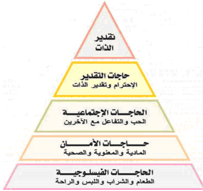
شكل رقم (٢.١)

قسم ماسلو Maslow الحاجات إلى خمس مجموعات كما هو موضح بالرسم :